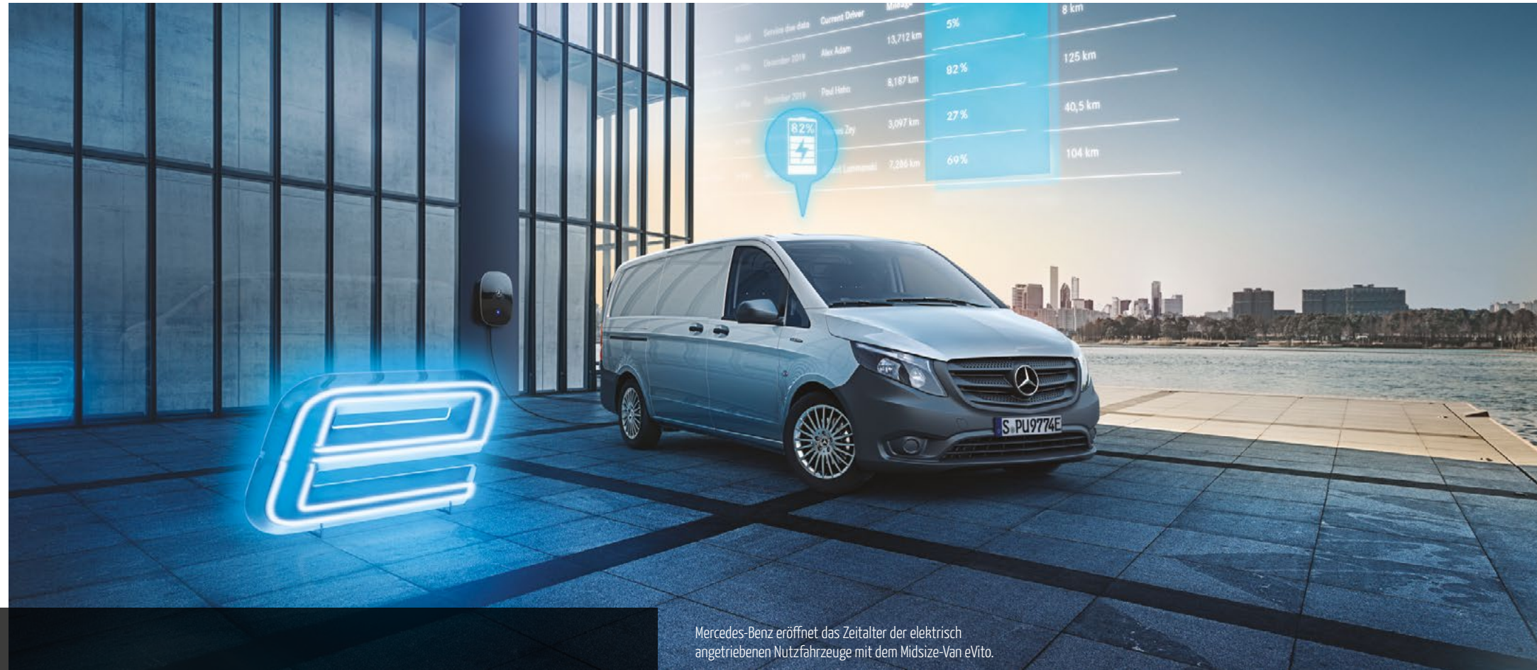
Mercedes-Benz eröffnet das Zeitalter der elektrisch angetriebenen Nutzfahrzeuge mit dem Midsize-Van eVito.