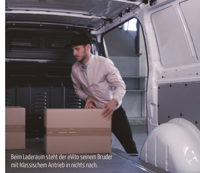
Beim Laderaum steht der eVito seinem Bruder mit klassischem Antrieb in nichts nach.