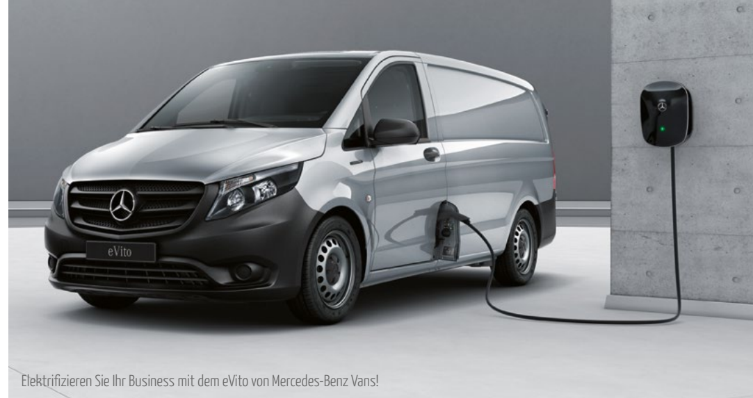
Elektrifizieren Sie Ihr Business mit dem eVito von Mercedes-Benz Vans!